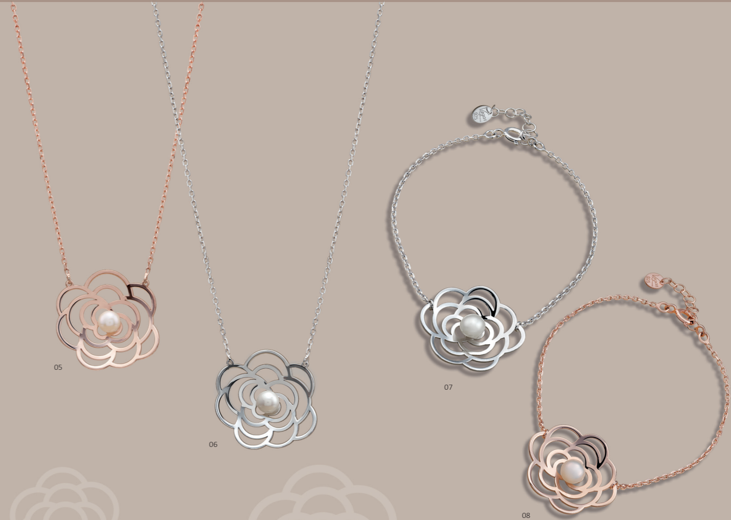
05 | „GYÖNGY” NYAKLÁNC | MEGR.-Sz.: 2471 | 169,00€ Nyaklác 925-ös sterling ezüsből, (rózsaarany), kaméliával (Ø 26 mm) és egy kézi foglaltos fehér gyöngy (Ø 6 mm). Méret: 40 + 2 cm