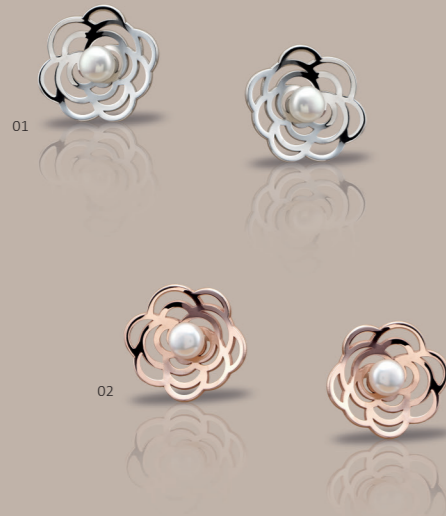
01 | „GYÖNGY” BESZÚRÓS FÜLBEVALÓ | MEGR.-Sz.: 2468 | 115,00€ Beszúros fülbevaló 925-ös sterling ezüsből, rhod., kaméliával (Ø 15 mm) és egy kézi foglaltos fehér gyöngy (Ø 5 mm) kiesésvédelemmel