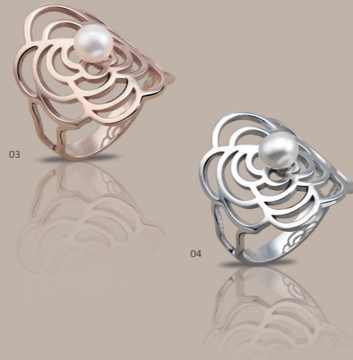
03 | „GYÖNGY” GYŰRŰ | MEGR.-Sz.: 2467 | 175,00€ Gyűrű 925-ös sterling ezüsből, (rózsaarany), kaméliával (25 x 18 mm) és egy kézi foglaltos fehér gyöngy (Ø 6 mm). Méret: 50-58*