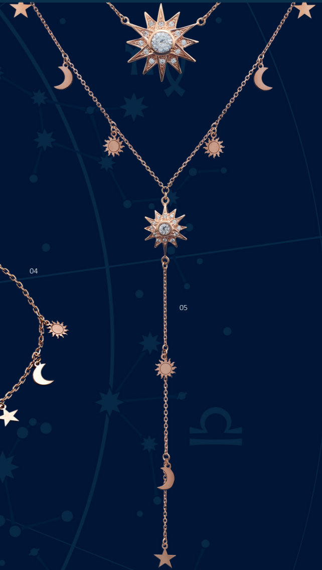
05 | ΚΟΛΙΕ Υ "ΑΣΤΕΡΙ" | ΑΡ. ΠΑΡΑΓΓ.: 2478 | 275,00€ Διπλό κολιέ από (ροζ επιχρυσωμένο) ασήμι 925 χιλιοστά, με διαστολή (7cm). Δύο αστέρια που βρίσκονται στο κέντρο (Ø 20mm και Ø 10mm) με 26 λευκά ζιρκόνια καρφωμένα με το χέρι και μικρά κρεμαστά σε σχήμα αστεριού, φεγγαριού και ήλιου. Μέγεθος: 37+2cm