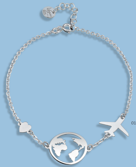
01 | ΒΡΑΧΙΟΛΙ "WORLD" ΑΣΗΜΙ | ΑΡ. ΠΑΡΑΓΓ.: 2453 -1 -2 | 69,90€ από ασήμι 925, επιροδ., με ένα αεροπλάνο, μια καρδιά και έναν παγκόσμιο χάρτη (Ø 16mm), 17cm (15+2)-1, 22cm (20+2)-2