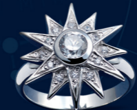
03 | ΔΑΧΤΥΛΙΔΙ "ΑΣΤΕΡΙ" | ΑΡ. ΠΑΡΑΓΓ.: 2476 | 139,00€ Δαχτυλίδι από ασήμι 925 χιλιοστά, επιροδ. Αστέρι (Ø 20mm) με 13 λευκά ζιρκόνια καρφωμένα με το χέρι. Μέγεθος: 50-58*