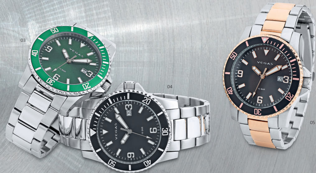
03 | ΑΝΤΡΙΚΟ ΡΟΛΟΙ | ΑΡ. ΠΑΡΑΓΓ.: 2442 | 249,00€ Αντρικό ρολόι με πράσινο καντράν (Ø 43mm), κάσα από ανοξείδωτο ατσάλι, πλάκα από ορυκτό κρύσταλλο, μπρασελέ από ανοξείδωτο ατσάλι μασίφ, ένδειξη ημερομηνίας, άριστης ποιότητας μηχανισμό quartz, αδιάβροχο 10 BAR