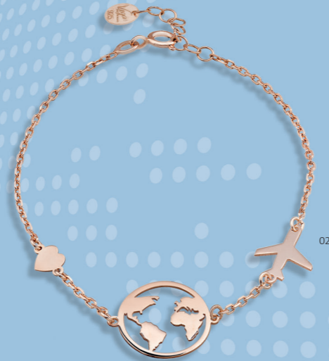
02 | ΒΡΑΧΙΟΛΙ "WORLD" ΡΟΖ ΧΡΥΣΟΣ | ΑΡ. ΠΑΡΑΓΓ.: 2456 -1 -2 | 69,90€ από ασήμι 925 (ροζ χρυσός), επιροδ., με ένα αεροπλάνο, μια καρδιά και έναν παγκόσμιο χάρτη (Ø 16mm), 17cm (15+2)-1, 22cm (20+2)-2