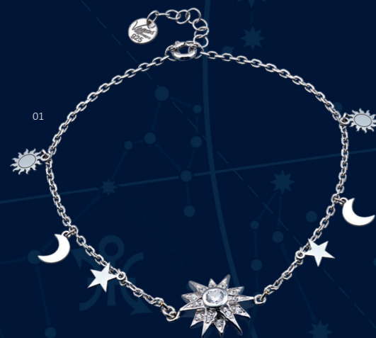
01 | PULSEIRA "ESTRELA" | CÓD. 2481 | 251,10 CHF Pulseira em Prata Esterlina de 1.ª Lei (925), rodiado. Estrela (Ø 15mm) com 13 zircónias brancas cravadas manualmente, pequenos pendentes em forma de estrela, lua e sol. Tam.: 18+2cm