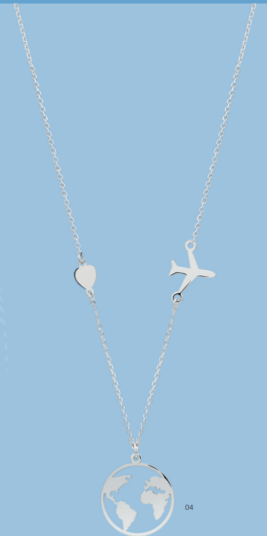
04 | COLAR "MUNDO" | CÓD. 2452 | 143,50 CHF Colar com mapa-mundo (Ø 16mm), coração e avião em Prata Esterlina de 1.ª Lei (925), rodado. Tam.: 42+2cm