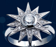
03 | ANEL "ESTRELA" | CÓD. 2476 | 232,30 CHF Anel em Prata Esterlina de 1.ª Lei (925), rodiado. Estrela (Ø 20mm) com 13 zircónias brancas cravadas manualmente. Tam.: 50-58*