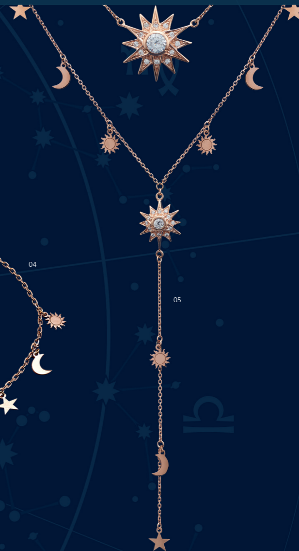
05 | COLAR-Y "ESTRELA" | CÓD. 2478 | 461,90 CHF Colar duplo em Prata Esterlina de 1.ª Lei (925), banho de ouro rosa, com fio pendente (7cm). Duas estrelas centrais (Ø 20mm e Ø 10mm) com 26 zircónias brancas cravadas manualmente, pequenos pendentes em forma de estrela, lua e sol. Tam.: 37+2cm