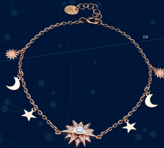
04 | PULSEIRA "ESTRELA" | CÓD. 2492 | 251,10 CHF Pulseira em Prata Esterlina de 1.ª Lei (925), banho de ouro rosa. Estrela (Ø 15mm) com 13 zircónias brancas cravadas manualmente, pequenos pendentes em forma de estrela, lua e sol. Tam.: 18+2cm