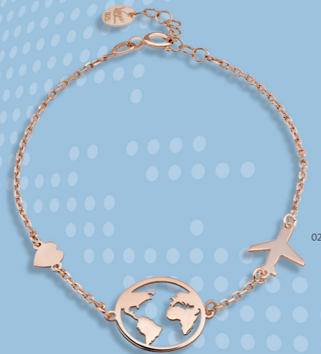
02 | PULSEIRA "MUNDO" | CÓD. 2456 -1 -2 | 101,50 CHF Pulseira com mapa-mundo (Ø 16mm), coração e avião em Prata Esterlina de 1.ª Lei (925), banho de ouro rosa, 17cm (15+2)-1, 22cm (20+2)-2