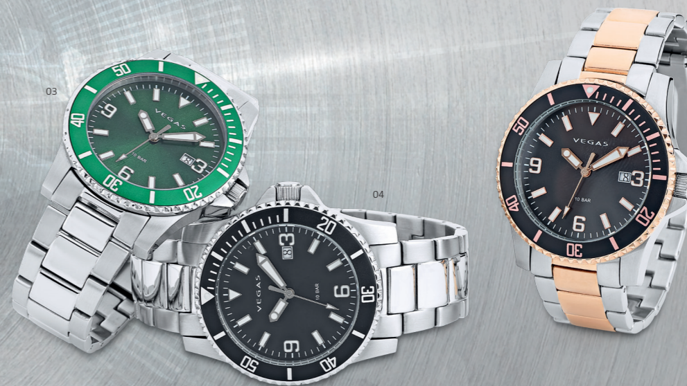
03 | RELÓGIO HOMEM | CÓD. 2442 | 362,60 CHF Relógio com mostrador verde (Ø 43mm), caixa e pulseira em aço inox, vidro em mineral, indicador da data, movimento quartz de elevada qualidade, à prova de água 10 ATM