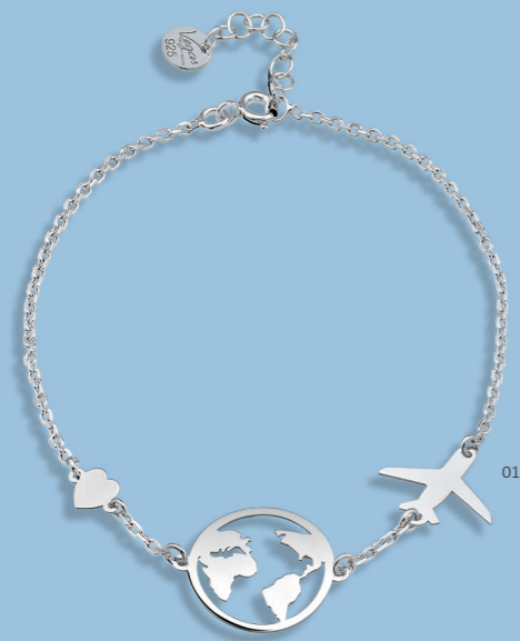
01 | PULSEIRA "MUNDO" | CÓD. 2453 -1 -2 | 101,50 CHF Pulseira com mapa-mundo (Ø 16mm), coração e avião em Prata Esterlina de 1.ª Lei (925), rodado, 17cm (15+2)-1, 22cm (20+2)-2