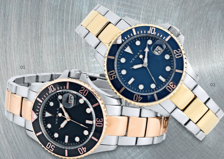
01 | RELÓGIO SENHORA | CÓD. 2445 | 348,60 CHF Relógio com mostrador preto (Ø 40mm), caixa e pulseira bicolor em aço inox, vidro em mineral, indicador da data, movimento quartz de elevada qualidade, à prova de água 5 ATM