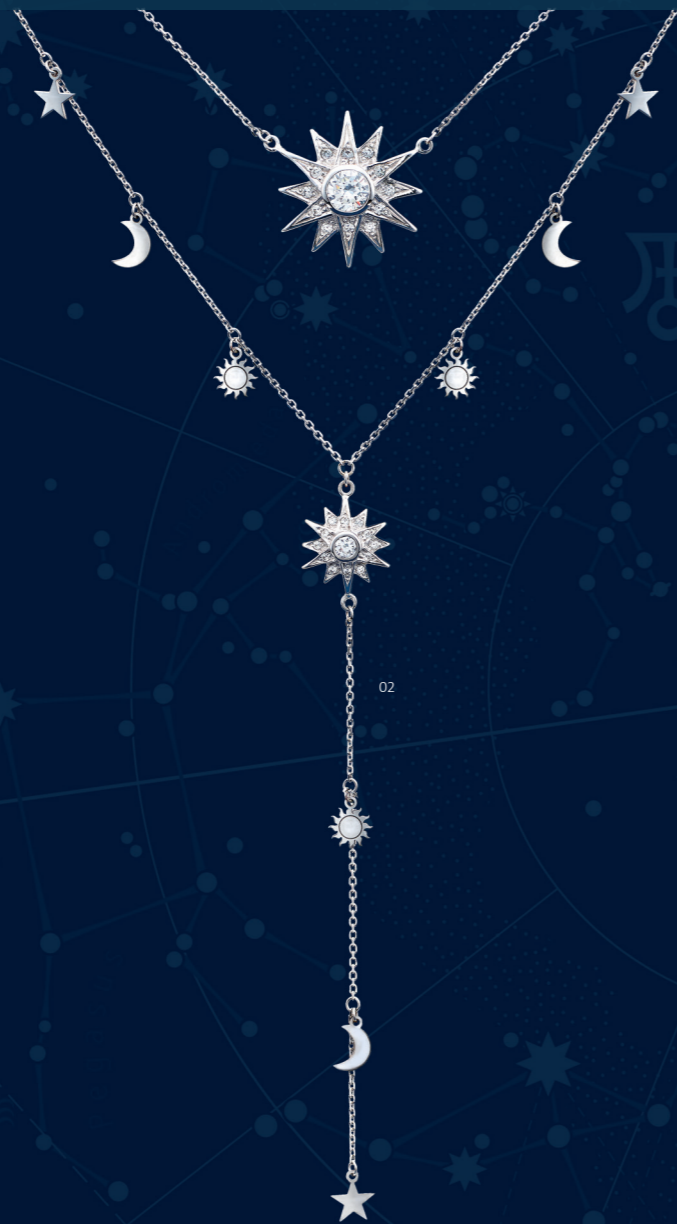
02 | COLAR-Y "ESTRELA" | CÓD. 2477 | 461,90 CHF Colar duplo em Prata Esterlina de 1.ª Lei (925), rodiado, com fio pendente (7cm). Duas estrelas centrais (Ø 20mm e Ø 10mm) com 26 zircónias brancas cravadas manualmente, pequenos pendentes em forma de estrela, lua e sol. Tam.: 37+2cm