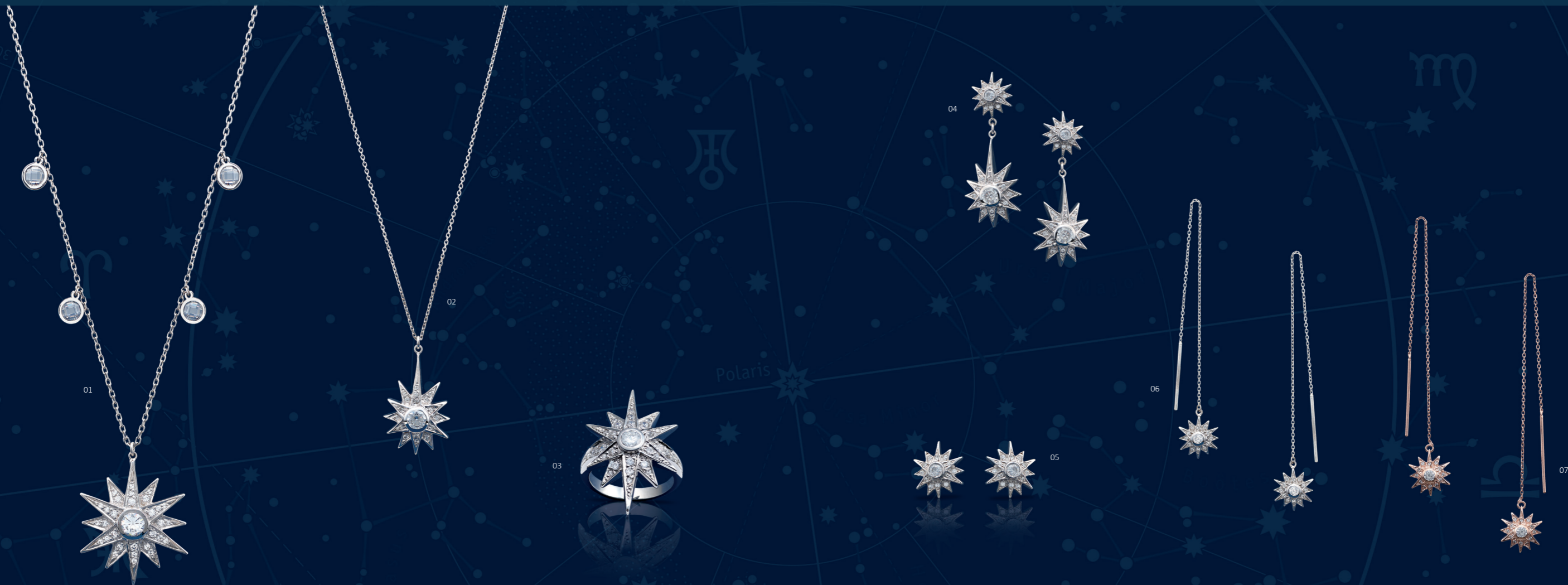
01 | COLAR “ESTRELA” | CÓD. 2474 | 530,10 CHF Colar em Prata Esterlina de 1.ª Lei (925), rodiado. Estrela (25x15mm) pendente com 31 zircónias brancas cravadas manualmente e 4 zircónias brancas penduradas no fio. Tam.: 70+2cm