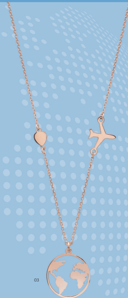
03 | COLAR "MUNDO" | CÓD. 2455 | 143,50 CHF Colar com mapa-mundo (Ø 16mm), coração e avião em Prata Esterlina de 1.ª Lei (925), banho de ouro rosa. Tam.: 42+2cm